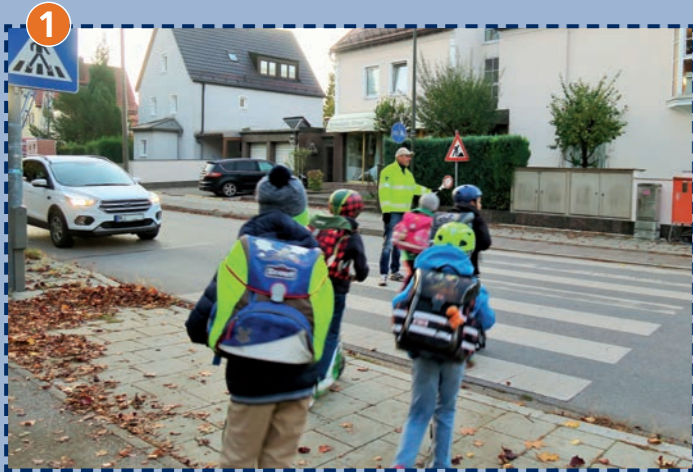
Fußgängerüberweg Lochhamer Straße/Spindlerplatz